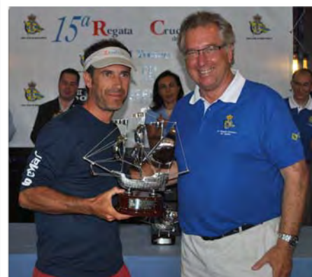
Vencedor Clase Crucero-Regata, 2012