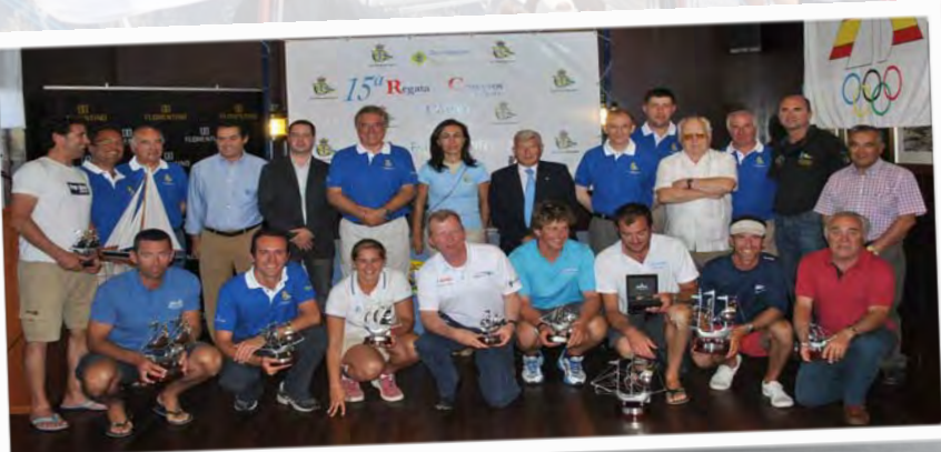
Premiados y autoridades 15ª Regata Cruceros de Aguete