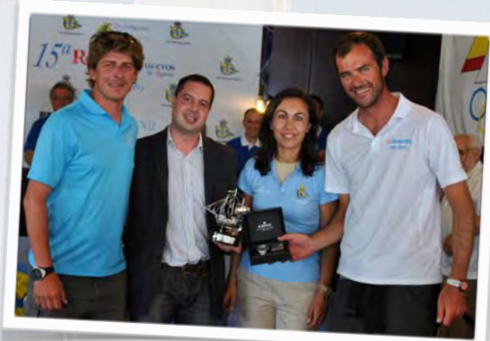
Vencedor Clase Regata, 2012