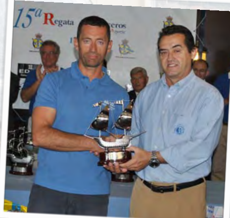
Vencedor Clase Crucero, 2012