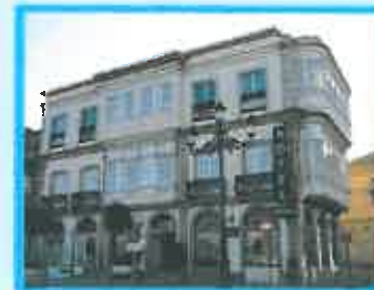
Hotel Pinzón 986.356.046

Aloxamento e desayuno: Doble 60€ día / Triple 80€ día (21% Iva). Media Pensión: Doble 90€ día/ Triple 125€ día (21% Iva).