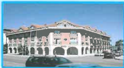
Hotel Bahía Bayona 986.385.004

A Organización informa a todos aqueles que desexen traer acompañante, que existe un convenio conseguido cos seguintes Hotels no prezo de aloxamento que será de: