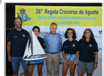
Vencedor Categoría VETERANOS 2023