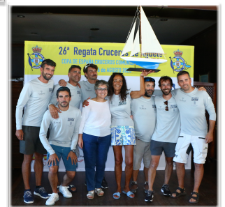
Vencedor O.R.C. CRUC/REGATA 2023