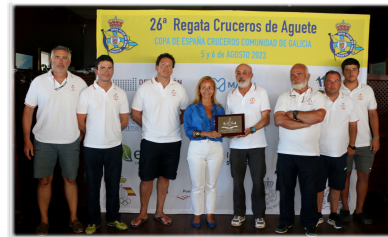
Vencedor O.R.C. REGATA 2023