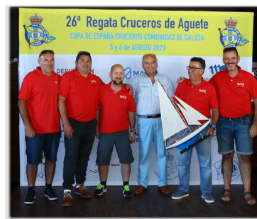
Vencedor O.R.C. CRUCERO 2023